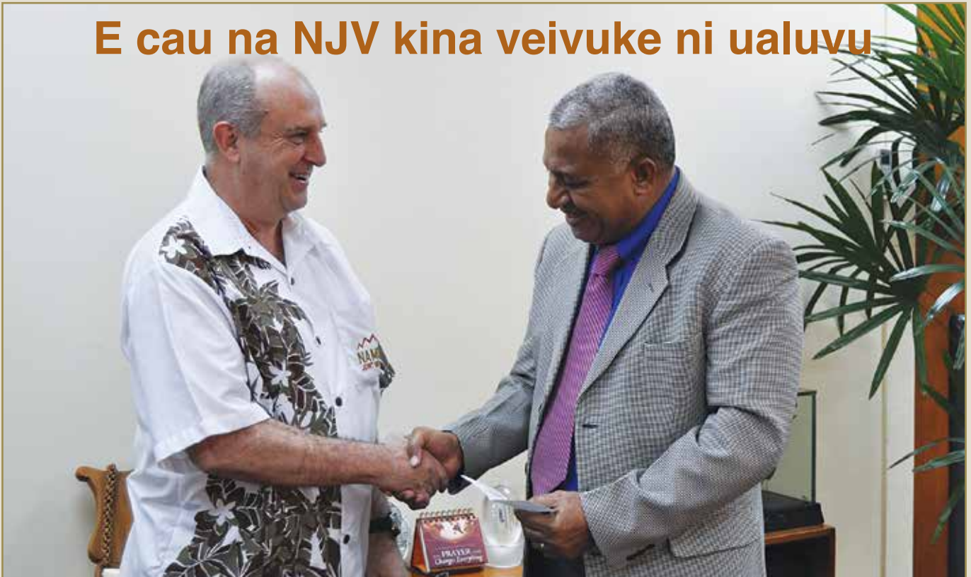
Ciqoma tiko na Paraiminisita o Voreqe Bainimarama na cau mai na NJV

E a solia e na vula ko Epereli kina tobu ni lavo ni veivuke ni ualuvu nona na Paraiminisita na Kabani na NJV e 10 na udolu na dola kei na dua na helicopter me veivuke e na vakau ni yaya ni veivuke e na gauna ni leqa oqo.