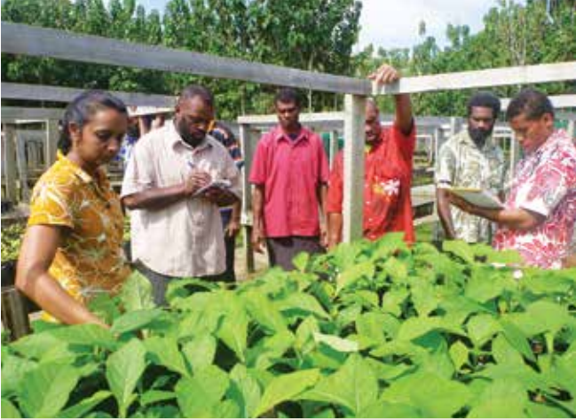
Ra va-kumuni tukutuku na lewe ni Mataqali o Naitavuni e na vanua ni bucibucini mai Mataso

Rau a duavata na Kabani na NJV kei na kabani na Future Forest Fiji e na vakarautaki ni nodra i lakolako ni vuli e na Okosita e lewe 18 na lewe ni Mataqali o Naitavuni mai na koro e rua o Delailasakau kei Nasevou.