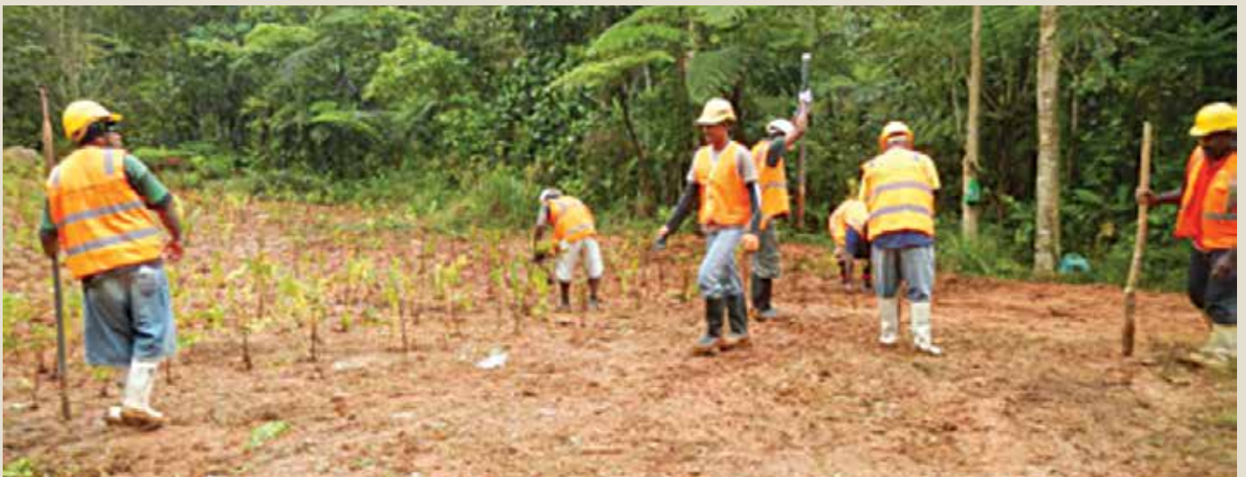
Na teivaki ni kau e so, ka tiki ni tuvatuva ni vakacoko

E na nodrau cakacaka-vata na Tikina Namosi Landowners Committee kei ira na kabani vakaitaukei era caka konitaraki, sa raica kina na NJV na nodra vaka-cakacakataka na lewe ni veikoro me ra tiki ni tuvatuva ni vakacoko.