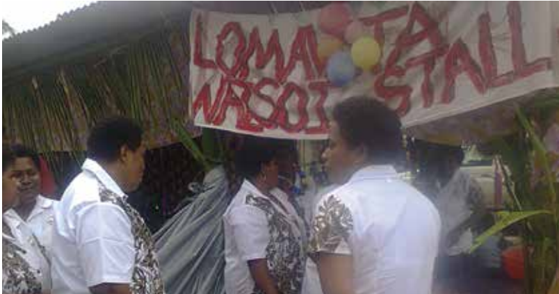
O ira na vakaillesilesi ni NJV e na vakatunuloa ni Lomavata Waisoi

A vakayacori e na rara ni koroni-vuli na Namosi Secondary na nodra basa vaka-yabaki, o ya e na Vakaraubuka na i ka tolu ni Okosita- kena i naki me kumuni na i lavo me vakatorocaketaki na koroni-vuli.