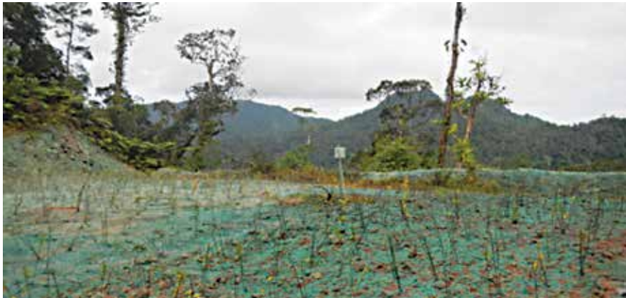
Na tiki-ni-gele ka teivaki tale e na balabala

E cakacaka vata na Kabani na Namosi Joint Venture (NJV) kei ira na i taukei-ni-gele kei na matanitu e na kena teivaki e sivia ni 100 na udolu na i tei ni kau wili kina na balabala ka rauta ni dua poidi tolu na milioni na dola na i sau ni tuvatuva ni vakacoko.