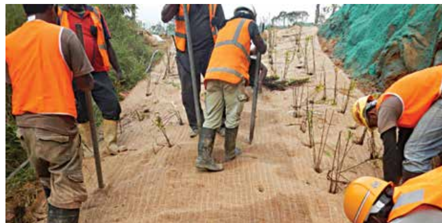
Teivaki na kau ena vanua vakacokotaki

Sa railesuva na Kabani na NJV na sala e so me taurivaki e na cakacaka ni vakadidike kei na sala e muri me rau cakacaka vaka-voleka sara kina kei ira na itaukei-ni-gele kei na qarauni ni tuvatuva e navuci me baleta na ta ni sala, na qaravi ni sala ni wai-ni-gunu, na vakarautaki ni vanua ni kelikeli kei na kena sogo kei na cakacaka ni vakacoko me na muria.