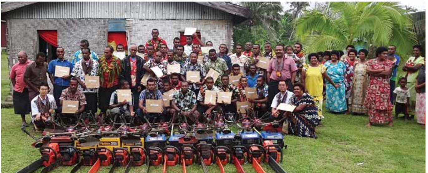
Oqo ko ira na lewe ni vuli ni sere i idini mai Nasevou