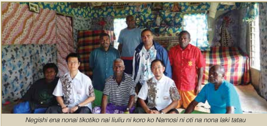
Negishi ena nonai tikotiko nai liuliu ni koro ko Namosi ni oti na nona laki tatau

Esa mai vakavinavinakataka talega vakalevu o Negishi na veiwekani vinaka e mai lewena voli kei ira na