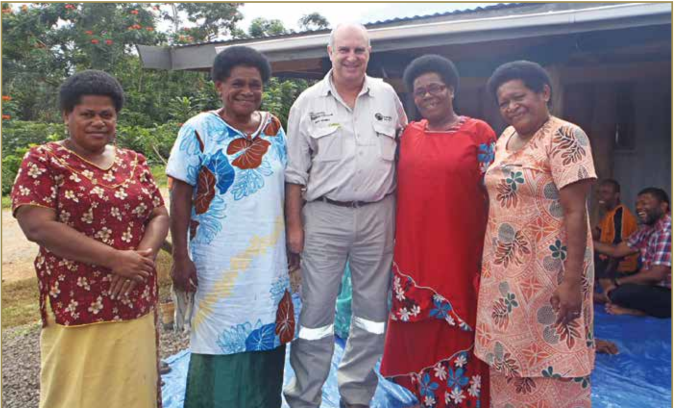
Ko Greg Morris kei ira na marama ni yavusa Naitavuni