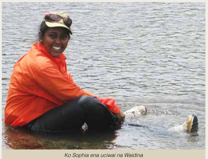
Ko Sophia ena uciwai na Waidina

na veika e baleti koya. Ena veigauna vinaka se gauna dredre e raica ni ra veitauriliga volia ga na vakaillesilesi ka ra qarava vata na nodra cakacaka, e dua na tikina e kaya o Sophia ni marautaka sara vakalevu.